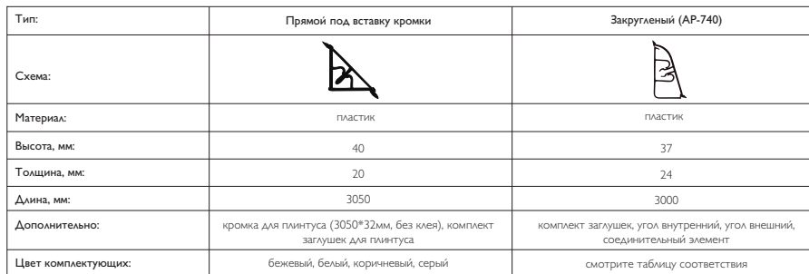
ТАБЛИЦА СООТВЕТСТВИЯ ЦВЕТОВ